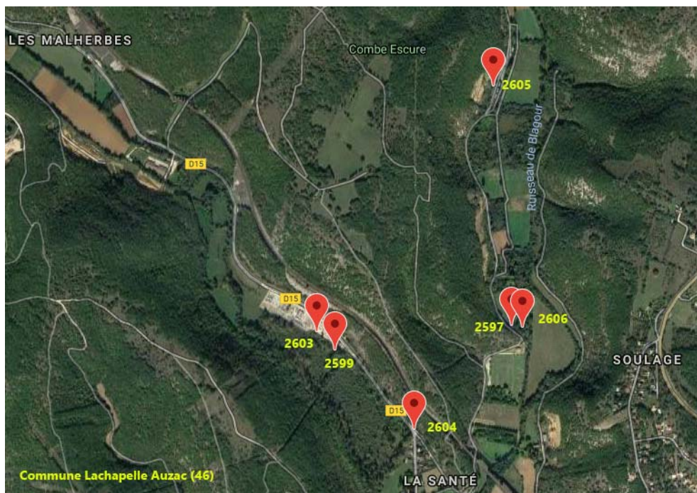
Carte de répartition des stations de collectes à Lachapelle-Auzac.