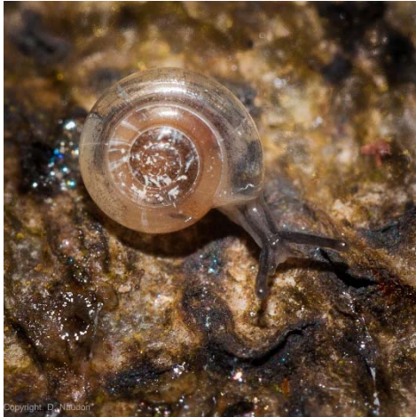
Vitrea crystallina. D.Naudon