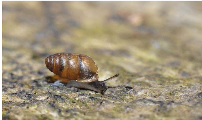
Lauria cylindracea. D. Naudon