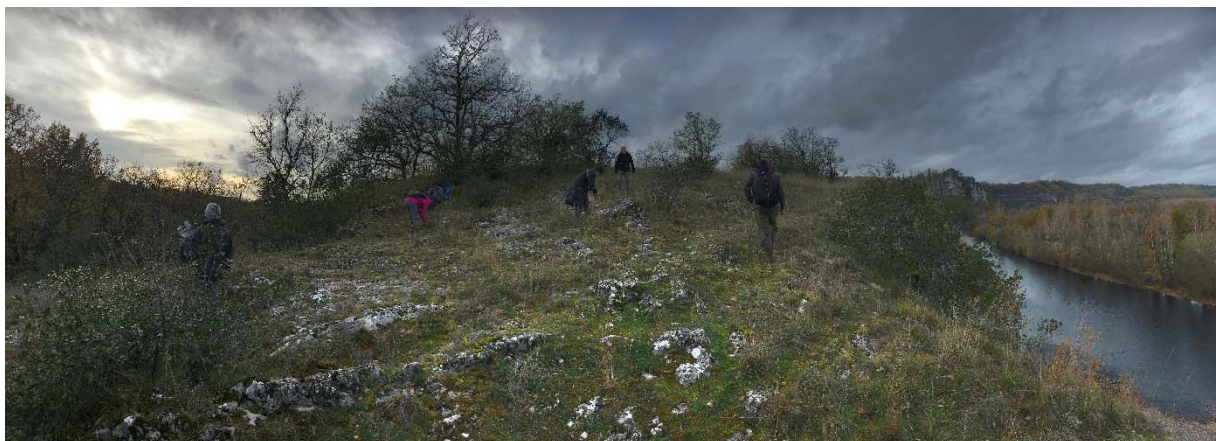
Belvédère de Copeyre.