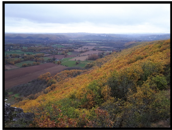
Vue sur le Causse